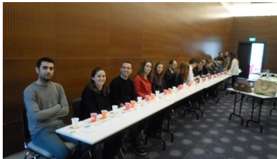
Yalın Üretim ve Tedarik Zinciri Eğitimi 25,26 Aralık 2013—02,03 Ocak 2014, Work Inn Hotel

Bu eğitimler ile proje kapsamında gerçekleştirilecek olan Yalın Üretim konulu danışmanlık faaliyetlerinden önce firmalar kendi bünyelerinde ön hazırlık yaparak danışmanlık faaliyetlerinde daha hızlı ilerleyerek, hedeflenen sonuçlara daha çabuk ulaşacaklardır.