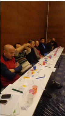
Yalın Üretim ve Tedarik Zinciri Eğitimi, 10,11,20, 21 Aralık 2013, Work Inn Hotel

10, 11, 20, 21 Aralık tarihlerinde gerçekleşen Yalın Üretim ve Tedarik Zinciri Yönetimi eğitimine katılım sağlayan firma çalışanlarının firmalarında maliyetlerin azaltılabilmesi için, kurumların verimliliklerine odaklanarak verimliliklerini arttırmaları gerektiği, Yalın Üretim ile üretim hızını arttırırken kalite, maliyet ve teslimat performanslarında da önemli ölçüde iyileştirmeler sağlayacakları anlatıldı.