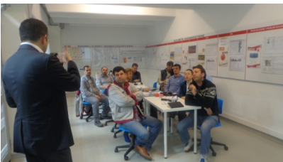
Sa-ba, D1 Danışmanlık Faaliyeti, 24 Ocak 2014

Danışmanlık gerçekleşen firmaların vizyonları Mind Map tekniği ile tanımlanmış, firmaların vizyon logoları oluşturulmuş ve Ana Stratejik Hedefler yıllara göre önceliklendirilerek yıllık temaları belirlenmiştir.