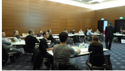
Yalın Üretim ve Tedarik Zinciri Eğitimi 25,26 Aralık 2013—02,03 Ocak 2014, Work Inn Hotel

Aynı eğitimin 2. etabı Mita Kalıp, A Raymond, İleri Mekanik, PlastMet ve Akplas firmalarının temsilcilerinin katılımı ile 25, 26 Aralık 2013 ve 02, 03 Ocak 2014 tarihlerinde Gebze Work Inn Hotel’de düzenlendi.