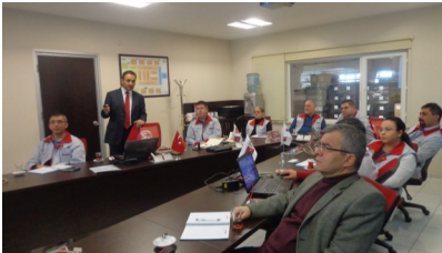
Plast Met, D1 Danışmanlık Faaliyeti, 10 Ocak 2014

Küresel Rekabet için Stratejilerin Oluşturulması konu başlıklı danışmanlık faaliyetinde, Proje katılımcı firmalarının sistem ve hedeflerle yönetim kavramlarının kurum bünyesinde yerleştirilerek, vizyon tanımlayarak ve stratejik hedefleri belirlenerek firmanın strateji ağacı oluşturulmuştur.