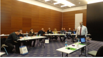
Yalın Üretim ve Tedarik Zinciri Eğitimi 10,11,20, 21 Aralık 2013, Work Inn Hotel

T.C. Ekonomi Bakanlığı, İhracat Genel Müdürlüğü, KOBİ ve Kümelendirme Destekleri Daire Başkanlığının desteklediği ve yürütücülüğünü Taşit Araçları Yan Sanayicileri Derneğinin (TAYSAD) üstlendiği ve danışmanlık ve eğitim faaliyetleri InoTec Teknoloji ve Yönetim Danışmanlığının gerçekleştirdiği “ Küresel Rekabet Yolunda Kurumsal Dönüşüm (URGE 018) ” projesi kapsamında planlanan eğitimlerden ilk dördü gerçekleştirildi.