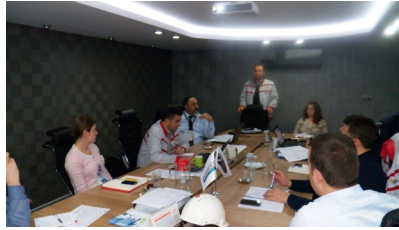
Ak-Pres, D2 Danışmanlık Faaliyeti, 13 Ocak 2014

Yapılan ikinci danışmanlık faaliyeti olan Küresel Rekabet Yolunda Kurumsal Dönüşüm Projelerinin Planlanması konu başlıklı danışmanlık faaliyeti ile katılımcı firmaların 13 ay sürecek olan 12K Model projesi boyunca yürütülecek projelerden biri olan Yalın Üretim projesinin planlanması, proje tanıtım kartları doldurulması, projelerin alt faaliyetlerinin belirlenmesi, projelerin Gantt Şemasının doldurulması, proje ekiplerinin görev dağılımlarının yapılmasına yönelik çalışmalar yürütülmüştür.